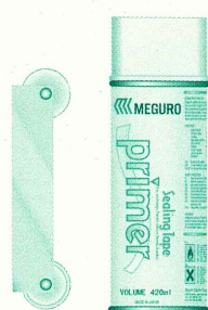
ローラー プライマー